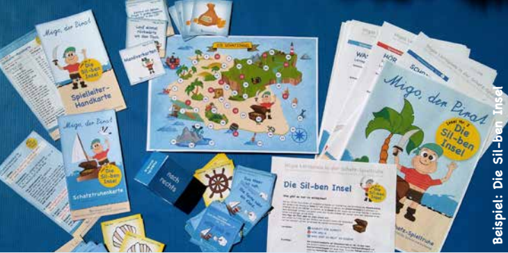
Beispiel: Die Sil-ben Insel

Migos Lernspiele in der Schatz-Spieltruhe umfassen die wichtigsten Rechtschreibbereiche für die 1. – 8. Schulstufe.